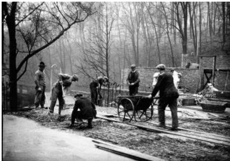
Práce na stavbě sborového domu