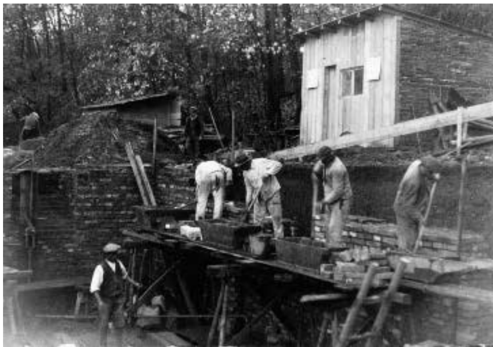
Práce na stavbě sborového domu

stěnách biblické citáty, které byly při jednom malování přebíleny a již nebyly obnoveny. Nad vchodem je symbol Bible a kalicha a nápis SLOVO PÁNĚ ZŮSTÁVÁ NA VĚKY.